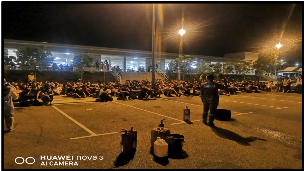
Taklimat Pemadam Api oleh Bomba