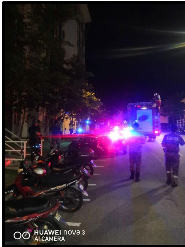
Bangunan Satria Kasturi ketiadaan Elektrik semasa membuat latihan penyelamat